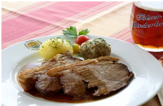
Speisekarte mit Zusatzstoffen und Allergene auf Anfrage.

Käsespätzle mit Röstzwiebeln und gemischtem Salat 11,20 €